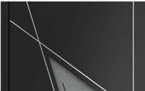
Detail Modell AL 2 Glas „Arzberg“, Klarglas mit Teilmattierung und erhabenen Edelstahllisenen

Flügelabdeckendes Türblatt, Glas „Elko“, Klarglas mit Teilmattierung, Seitenteil Glas „Elko“, vollflächige Mattierung, hochwertige Applikationen: Außenseite erhabene oder planflächige 5 mm Edelstahllisenen oder erhabene, schwarze 5 mm Lisenen, Innenseite Ziernuten, Griff ZAE6S 1600 mm